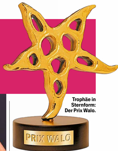
Trophäe in Sternform: Der Prix Walo.

Im Sommer ist «G&G» Geschichte. Es war ein Schock für das ganze Team, dass der Sparhammer beim SRF-Gesellschaftsmagazin «Gesichter und Geschichten» voll zugeschlagen hat. Eine der Betroffenen ist Moderatorin Jennifer Bosshard (31). Bis dann stehen bei der Baselbieterin spannende SRF-Extrashows an. Am 11. Mai vergibt sie im Rahmen des ESC-Finales vor mehr als 100 Millionen Menschen live die Punkte für die Schweiz. Ihre Beliebtheit hat ihr nun auch eine Nominierung für einen Prix Walo als Publikumsliebbling eingebracht.