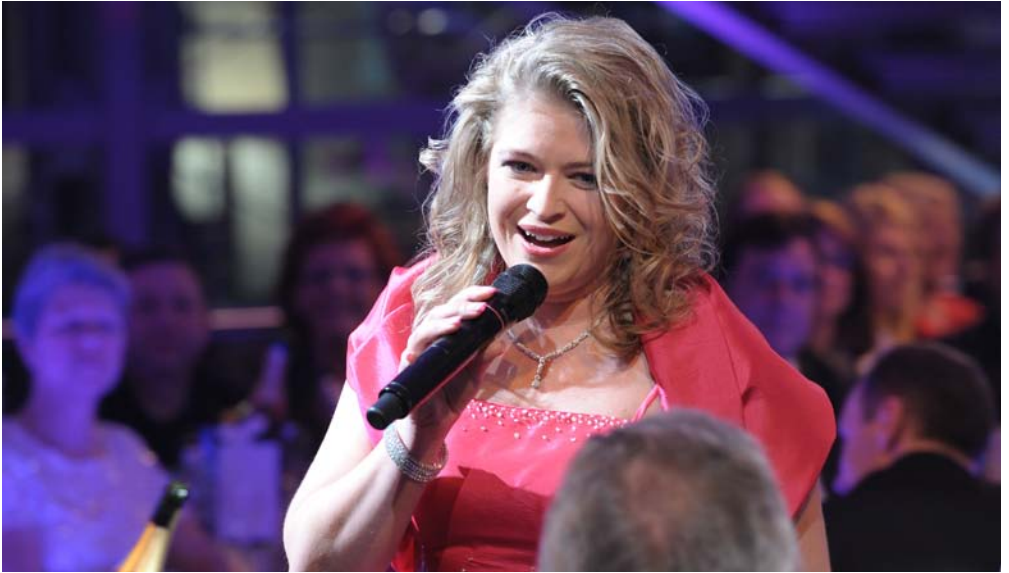
Monique singt ihren Hit «Mensch ärgere dich nicht».