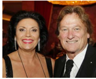
Monika Kaelin mit Schatz Fritz Künzli.