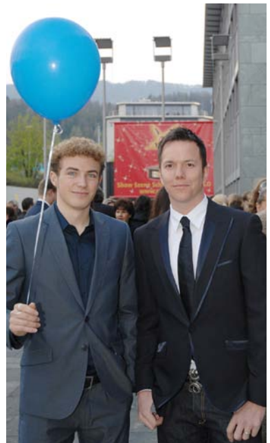
Michael Elsener und Sven Epiney