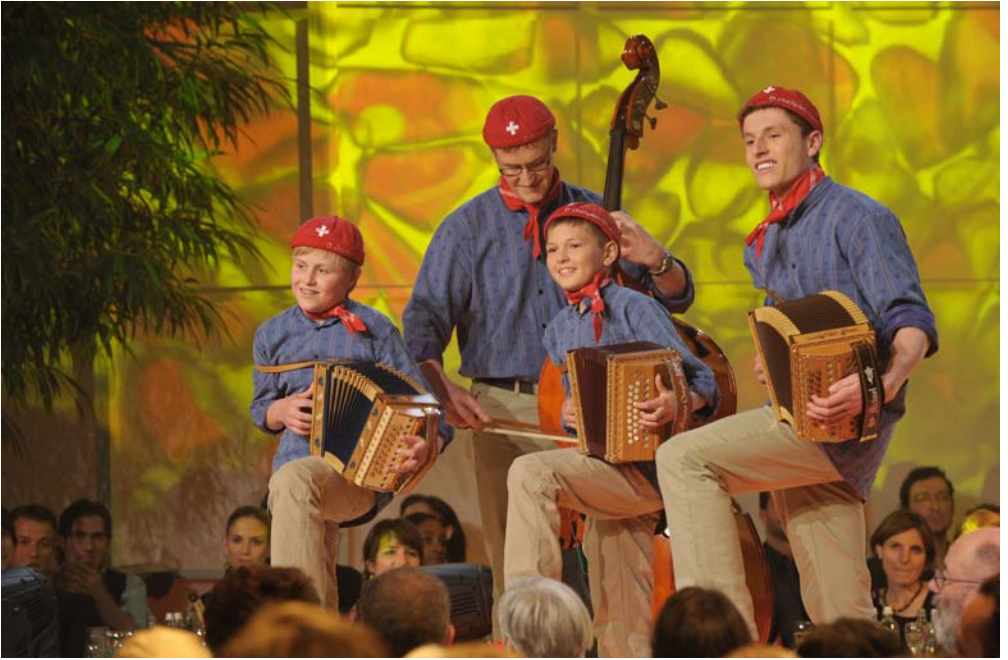
Chnöpflidröcker vo Hergiswil, Luzern: Sieger des KLEINEN PRIX WALO in der Sparte Volksmusik.