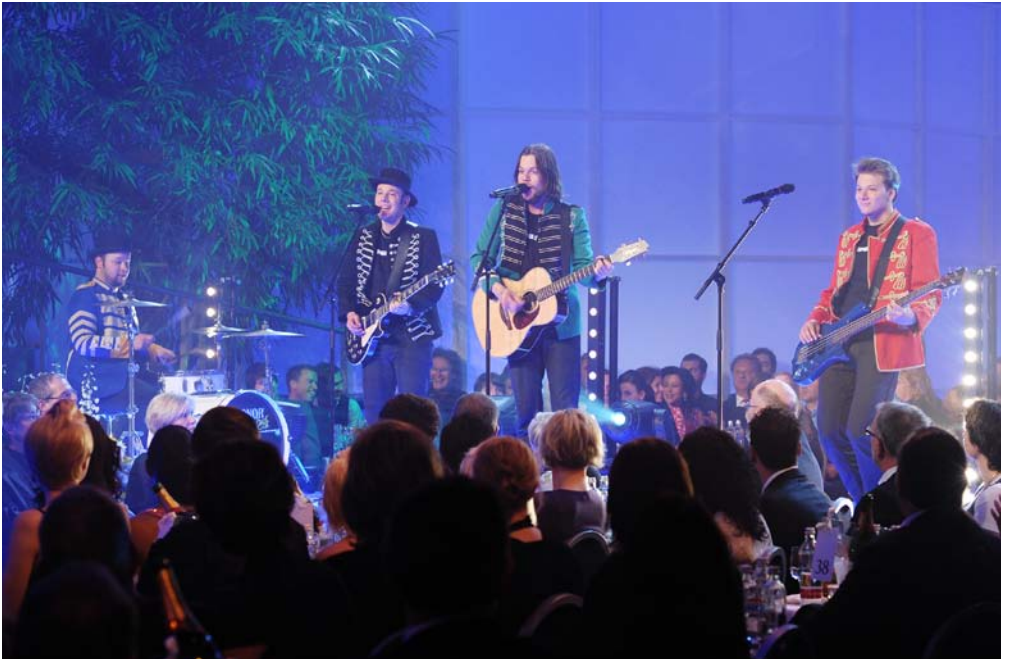
77 Bombay-Street, Sieger des KLEINEN PRIX WALO in der Sparte Band.