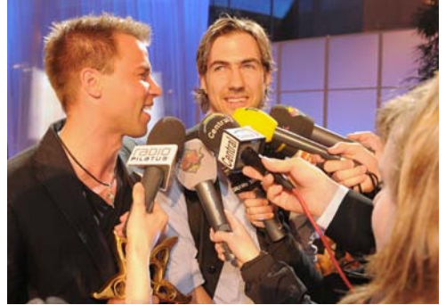
... Divertimento werden belagert ...