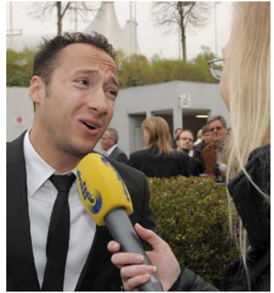
Ritschi mit viel Mimik im Interview.